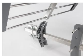
Système CLIC CLAC Montage facile

Dipôle clipable sur la structure Clip renforcé pour une meilleur tenue